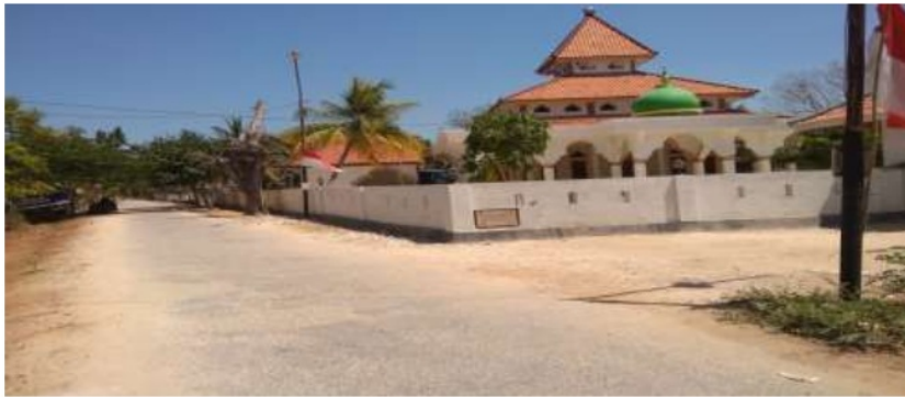
Gambar 6.3 Bantuan Pagar Masjid Ky. Bustomi yang telah selesai 100% dan Bantuan loadpeakers masjid Desa Aeng Anyar