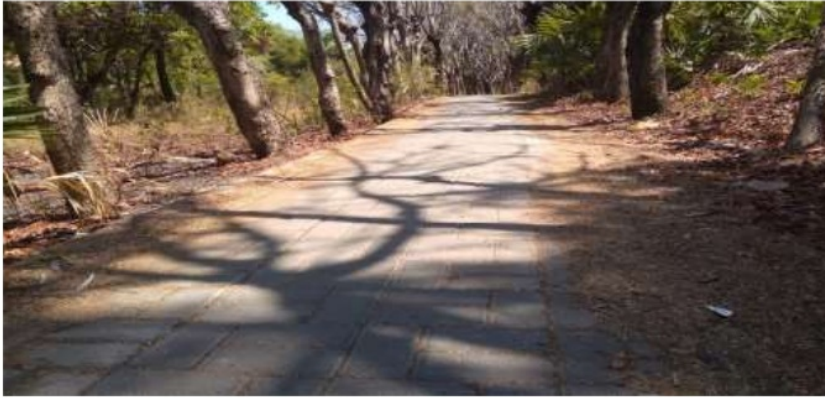
Gambar 6.2 Bantuan Paving Stone Desa Galis