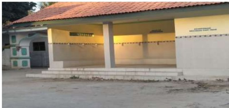
Gambar 6.4 Bantuan MCK Masjid Gedugan Desa Gedugan