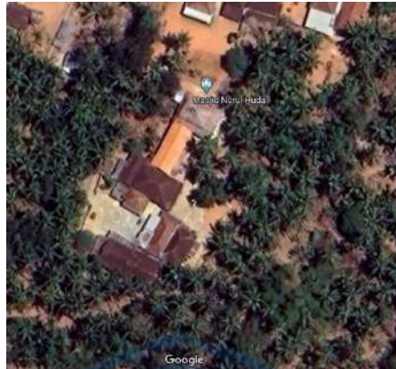
Gambar 1. 1 Lokasi Mitra

Terdapat kelebihan dari lokasi mitra yaitu terdapat mushollah yang nantinya akan menjadi tempat ibadah untuk para santri, juga terdapat lahan kebun kelapa yang luas di lokasi tersebut dan nantinya akan di jadikan lokasi pembangunan. Dapat di lihat dari gambar1.2.