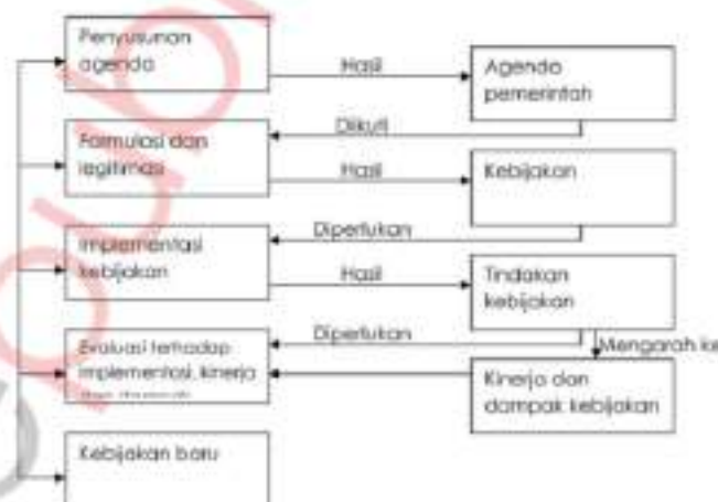
Gambar 1.1 Tahapan Kebijakan Publik

Pandangan Ripley (dalam Subarsono), tahapan kebijakan publik digambarkan sebagai berikut: