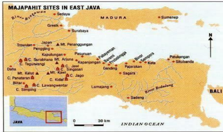
Gambar 1 Peta Persebaran Situs Cagar Budaya di Jawa Timur