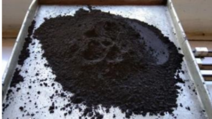
Gambar 2. Limbah abu batok kelapa

Kecamatan Kota Kabupaten Sumenep dimana masing-masing bahan telah lolos saringan nomor 200. Pada gambar 2 dan 3 diberikan sampel abu batok kelapa dan kapur hidrolis yang telah diayak melalui saringan angregat nomor 200.