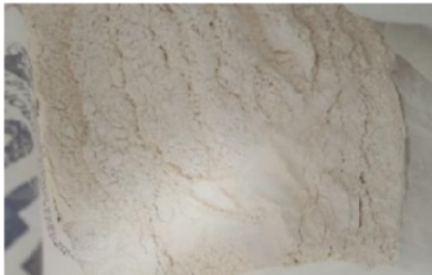
Gambar 3. Serbuk kapur hidrolis

Selanjutnya kedua bahan substitusi (abu batok kelapa dan serbuk kapur hidrolis) dilakukan uji bahan untuk mengetahui kemiripan karakteristik bahan dengan karakteristik semen. Adapun hasil uji laboratorium terhadap karakteristik semen, abu batok kelapa, kapur hidrolis dan campuran antara abu batok kelapa dengan kapur hidrolis disajikan pada tabel 1 dibawah ini.