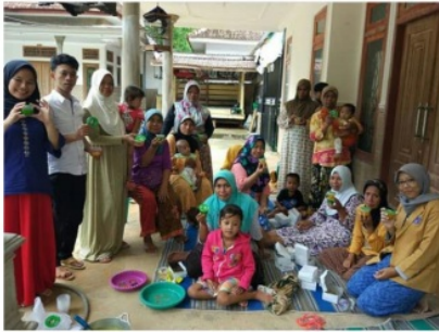
Gambar. Pelatihan pembuatan manisan buah siwalan