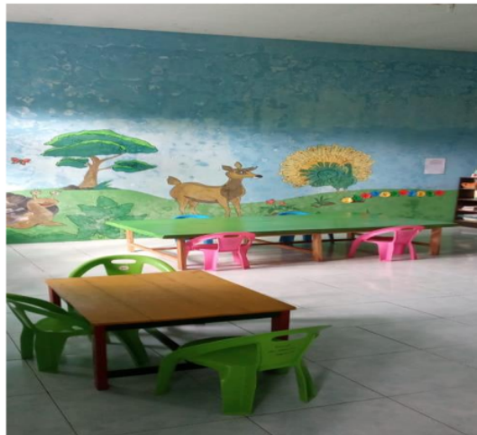
Gambar 4. Ruang Reading Corner setelah didekor ulang.

Pendampingan akan terus dilakukan oleh tim pengabdian masyarakat Universitas Wiraraja sebagai bentuk apresiasi karena telah bekerja sama dengan Universitas dalam meningkatkan kesejahteraan masyarakat desa Patean khususnya PAUD Al-Hasan