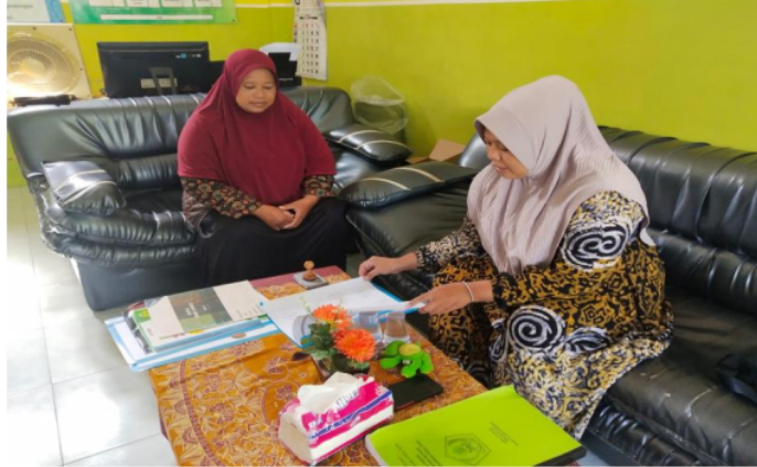
Gambar 2. Ketua Tim PKM Unjia Bersama Kepala PAUD Al-Hasan berdiskusi tentang kegiatan yang akan dilakukan Tim selama 1 tahun di PAUD AL-Hasan.