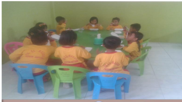
Gambar 1. Kondisi awal ruang kelas PAUD AI-Hasan

Observasi dilakukan oleh tim pengabdian di PAUD AI-Hasan Desa Patean pada hari Senin, 6 Mei 2021. Observasi dilakukan untuk mendapatkan informasi terkait permasalahan yang muncul di masyarakat berkaitan dengan literasi. Hasil observasi menunjukkan bahwa di PAUD AL-Hasan tidak ada ruang baca dan buku buku untuk dibaca oleh anak anak usia dini. Anak jarang mendapat kesempatan untuk membaca buku. Anak-anak lebih mewarnai dan menulis daripada melakukan kegiatan yang melibatkan fisik seperti membaca.