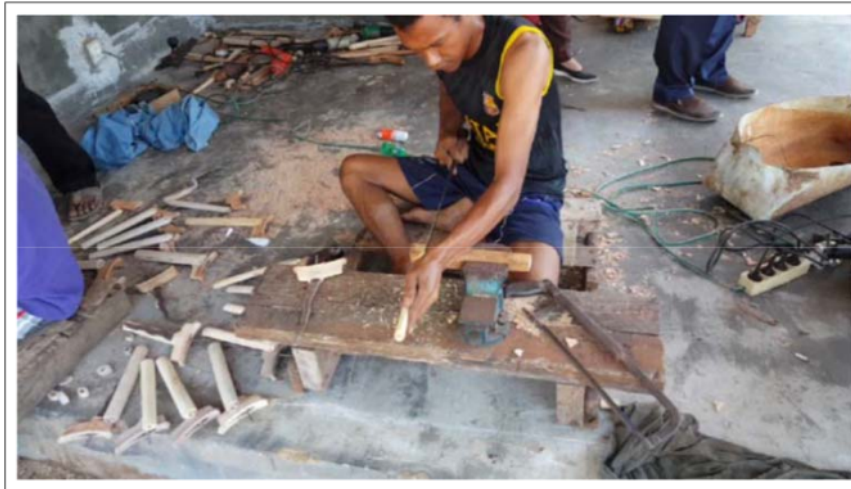
Gambar 1. Proses produksi yang dilaksanakan di UMKM Keris Kabupaten Sumenep

Dari berbagai hasil analisa potensi pada UMKM kerajinan keris yang ada, maka didapatkan hasil bahwa kesinambungan antara tahapan pra produksi, produksi dan pasca produksi akan sangat penting untuk saling terkait. Keterkaitan tersebut adalah dikarenakan satu tahapan dengan tahapan lainnya harus berjalan berurutan dan bersinergi.