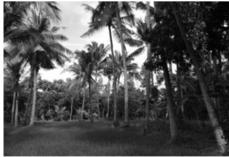
Pohon Buah Kelapa

Kelapa merupakan salah satu jenis tumbuhan dari aren-arenan yang merupakan anggota tunggal dalam marga Cocos . Semua bagian dari tanaman kelapa dapat dimanfaatkan seperti daun kelapa, sabut kelapa, batok kelapa, daging kelapa, air kelapa, bahkan batang kelapa. Sebagian besar lahan pertanian Desa Banuaju Barat ditumbuhi oleh pohon kelapa.