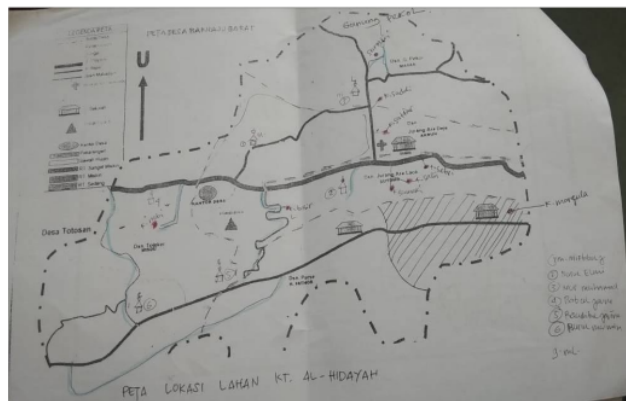
Gambar : Peta wilayah Banuaju Barat

Secara letak geografis Desa Banuaju Barat terletak sekitar 20 km dari Kabupaten Sumenep kurang lebih sekitar 45 menit. Berikut peta desa Banuaju Barat :