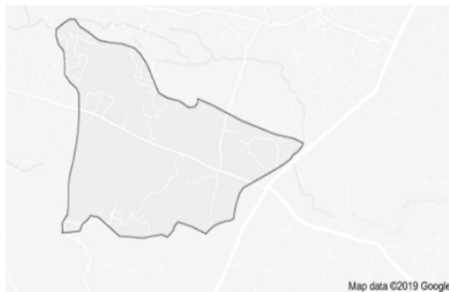
Gambar 1.1 Peta Desa Jenanger

Desa Jenanger merupakan salah satu desa yang terletak di Kecamatan Batangbatang, Kabupaten Sumenep, Provinsi Jawa Timur. Desa Jenanger terletak diantara 6^{\circ}57'23.31''S lintang selatan dan 114^{\circ}1'19.35T bujur timur. Desa Jenanger di sebelah barat berbatasan dengan desa Totosan, sebelah timur berbatasan dengan desa Candi, dan sebelah utara berbatasan dengan desa Nyabekan, dan sebelah selatan berbatasan dengan desa Banyuaju barat. Desa Jenanger terdiri dari 6 desa, yaitu desa Sambirampak, desa Jenang, desa Nyabungan, desa Paoto'an, desa Gunung Pikul, dan desa Kalompang.