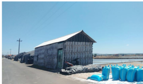
Gudang Semi Permanen Milik Petani Garam