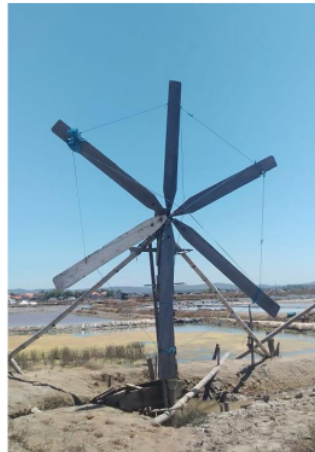
Kincir Angin Tambak Garam Desa Karanganyar