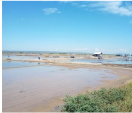
Tambak Garam Di Desa karanganyar