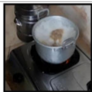
Gambar 17. Ina Merebus Kerang