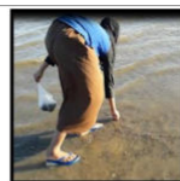
Gambar 15. Nor Mencari Kerang yang Terdampar di Permukaan Pasir