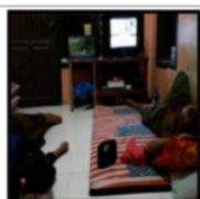
Gambar 21. Nor dan Bapaknya Nonton TV Sampai Tidur

Aktivitas sehari-hari anak nelayan tersebut menunjukkan rutinitas anak nelayan dalam membantu bekerja a gherri jhuko' dan arang-karang untuk meningkatkan pendapatan ekonomi