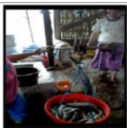
Gambar 5. Menimbang Massa Ikan Bloso