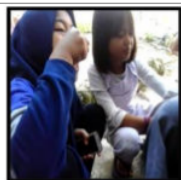
Gambar 19. Ifa Makan Rujak Kerang

Aktivitas malam hari anak nelayan adalah mengaji/tarawih dan tadarus (khusus bulan puasa), nonton TV, lalu tidur.