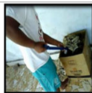
Gambar 13. Pengemasan Ikan Janggala' Kering

Aktivitas sore hari anak nelayan adalah mencari kerang ( arang-karang ) saat air laut surut ( aēng asat ). Mereka menggali pasir menggunakan sendok untuk arang-karang yang tertimbun pasir, serta berjalan sambil melihat ke bawah dan sekitarnya untuk arang-karang yang terdampar di permukaan pasir. Kerang yang diperoleh dijual untuk menghasilkan uang jajan sendiri. Ada juga yang uang hasil penjualan kerang diberikan kepada orang tua, sehingga dapat membantu memenuhi kebutuhan hidup keluarga. Sebagian kerang ada yang dimasak untuk dirujuk bersama teman-temannya.