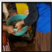
Gambar 16. Nor Menjual Kerang