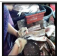
Gambar 8. Ifa a gherri Ikan Bloso