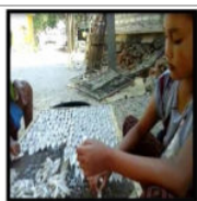
Gambar 10. Ise Menata Ikan Janggala' ke Sanoko