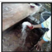
Gambar 9. Mencuci dan Mengasinkan Ikan Bloso