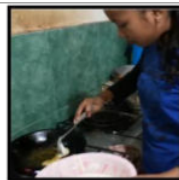
Gambar 1. Nor Memasak

Aktivitas pagi hari anak nelayan adalah membantu pekerjaan rumah (menyapu, mencuci alat dapur dan pakaian, memasak), menyiapkan diri ke sekolah (mandi, mengenakan seragam, sarapan), lalu berangkat sekolah.