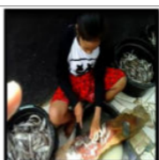
Gambar 7. Nor Memotong Ekor Ikan Co'o Pote