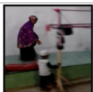
Gambar 20. Ise Berangkat Mengaji

Aktivitas malam hari anak nelayan adalah mengaji/tarawih dan tadarus (khusus bulan puasa), nonton TV, lalu tidur.