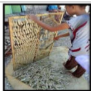
Gambar 12. Ise Mengangkat Jemuran Ikan Co'o Pote Kering