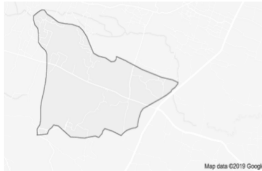
Gambar 1.1 Peta Desa Jenangger

Desa Jenangger merupakan salah satu desa yang terletak di Kecamatan Batangbatang, Kabupaten Sumenep, Provinsi Jawa Timur. Desa Jenangger terletak diantara 6^{\circ}57'23.31''S lintang selatan dan 114^{\circ}1'19.35T bujur timur. Desa Jenangger di sebelah barat berbatasan dengan desa Totosan, sebelah timur berbatasan dengan desa Candi, dan sebelah utara berbatasan dengan desa Nyabekan, dan sebelah selatan berbatasan dengan desa Banyuaju barat. Desa Jenangger terdiri dari 6 desa, yaitu desa Sambirampak, desa Jenang, desa Nyabungan, desa Paoto'an, desa Gunung Pikul, dan desa Kalompang.