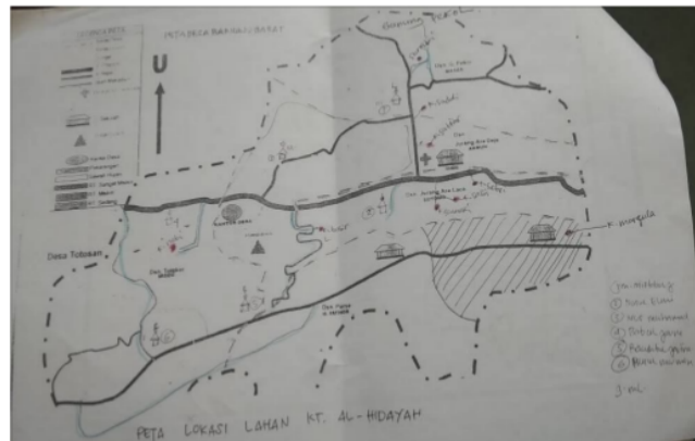
Gambar : Peta wilayah Banuaju Barat

Secara letak geografis Desa Banuaju Barat terletak sekitar 20 km dari Kabupaten Sumenep kurang lebih sekitar 45 menit. Berikut peta desa Banuaju Barat :