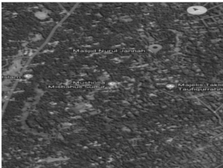
Gambar: Peta Desa Banuaju Timur

Desa Banuaju terdiri dari lima dusun diantaranya Dusun Pettong, Dusun Panggung, Dusun Gunung Pekol, Dusun Banyo Rabe, dan Dusun Mani'an. Berikut peta Desa Banuaju Timur :