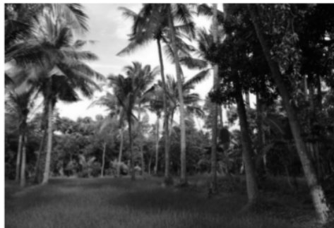
Pohon Buah Kelapa

Kelapa merupakan salah satu jenis tumbuhan dari aren-arenan yang merupakan anggota tunggal dalam marga Cocos . Semua bagian dari tanaman kelapa dapat dimanfaatkan seperti daun kelapa, sabut kelapa, batok kelapa, daging kelapa, air kelapa, bahkan batang kelapa. Sebagian besar lahan pertanian Desa Banuaju Barat ditumbuhi oleh pohon kelapa.