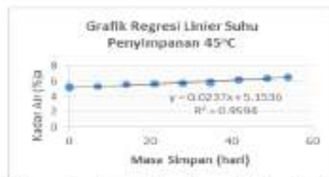
Gambar 2. Regresi Linier peningkatan kadar air produk kopi lengkuas instan pada suhu penyimpanan 45°C.