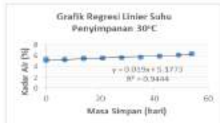
Gambar 1. Regresi Linier peningkatan kadar air produk kopi lengkuas instan pada suhu penyimpanan 30°C.