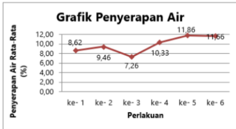
Gambar 2. Grafik Penyerapan Air Paving blok

dan bahan tambahan yang berupa limbah botol plastik sebanyak 0,50% terhadap campuran paving blok dalam benda uji.