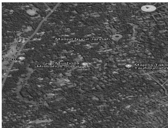
Gambar: Peta Desa Banuaju Timur

Desa Banuaju terdiri dari lima dusun diantaranya Dusun Pettong, Dusun Panggung, Dusun Gunong Pekol, Dusun Banyo Rabe, dan Dusun Mani'an. Berikut peta Desa Banuaju Timur :