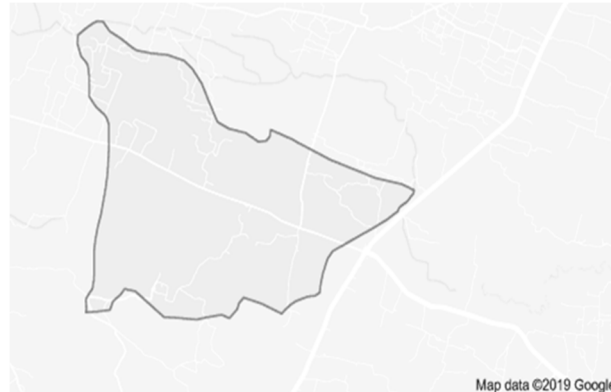
Gambar 1.1 Peta Desa Jenangger

Desa Jenangger merupakan salah satu desa yang terletak di Kecamatan Batangbatang, Kabupaten Sumenep, Provinsi Jawa Timur. Desa Jenangger terletak diantara 6^{\circ}57'23.31''S lintang selatan dan 114^{\circ}1'19.35T bujur timur. Desa Jenangger di sebelah barat berbatasan dengan desa Totosan, sebelah timur berbatasan dengan desa Candi, dan sebelah utara berbatasan dengan desa Nyabekan, dan sebelah selatan berbatasan dengan desa Banyuaju barat. Desa Jenangger terdiri dari 6 desa, yaitu desa Sambirampak, desa Jenang, desa Nyabungan, desa Paoto'an, desa Gunung Pikul, dan desa Kalompang.